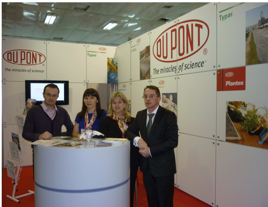
Стенд компании DuPont на выставке «СтройСиб 2011»

строительства, при котором конструкция, бывает, остается незащищенной должным образом фасадным или кровельным покрытием на долгое время.